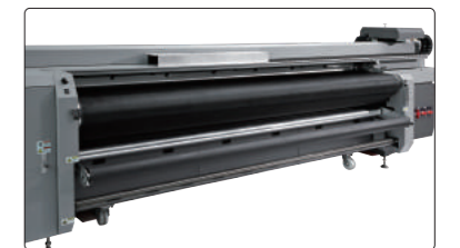
纠偏系统与张力调节装置